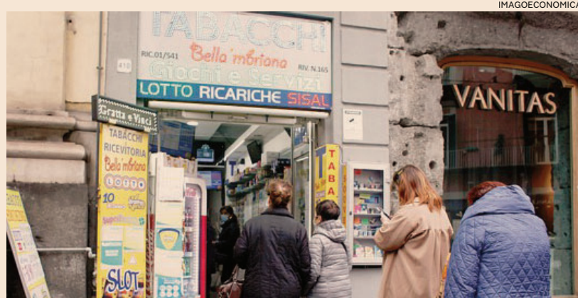
Tabacchi. Dalla rete di vendita arrivano all'Erario circa 15 miliardi di euro l'anno

La rete di distribuzione di Logista Italia serve circa 60.000 punti vendita (tabaccherie e negozi di prossimità) arrivando a coprire settimanalmente