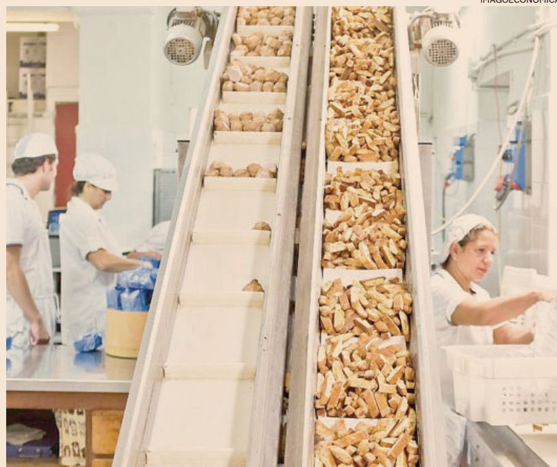
Il rinnovo. L'ultimo contratto dell'industria alimentare è scaduto a novembre del 2023

La durata e l'aumento La durata dell'accordo, secondo quanto trapela dal negoziato in corso da martedì, dovrebbe essere quadriennale, ma ancora in tarda serata le parti non erano arrivate alla definizione del trattamento economico complessivo. C'è comunque una sostanziale conferma dell'accordo sui minimi. Negli incontri che si sono svolti a metà dello scorso mese, aziende e sindacati hanno infatti trovato una convergenza su un incremento di 214 euro per il trattamento economico minimo. Nella piattaforma rivendicativa, però, i sindacati chiedevano circa 300 euro complessivi, comprendendo anche il cosiddetto incremento aggiuntivo della retribuzione, lo far, un istituto divenuto dirimente nel contratto siglato nel 2020, e il rafforzamento dei principali istituti di welfare. La dinamica