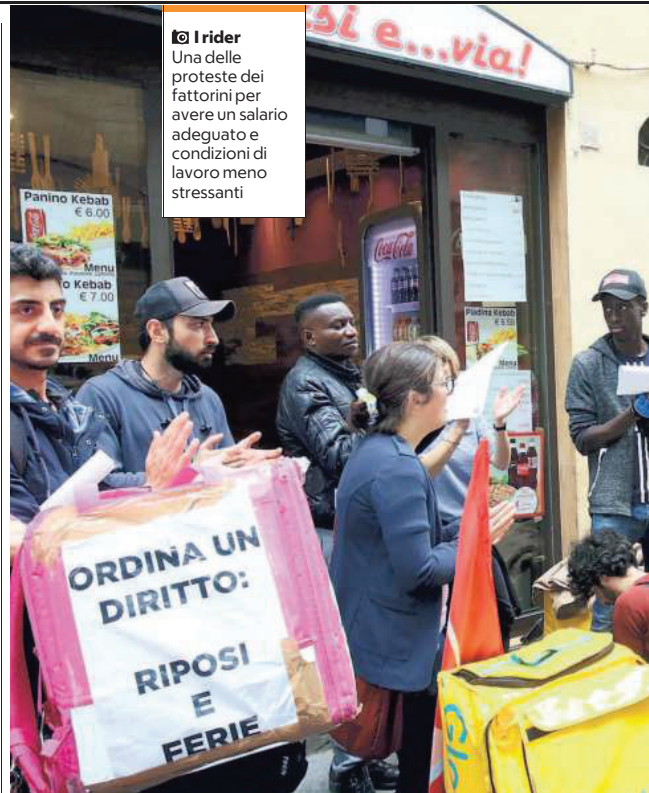
📷 I rider Una delle proteste dei fattorini per avere un salario adeguato e condizioni di lavoro meno stressanti

In linea molto teorica, ipotizzando che questi siano tutti lavoratori a tempo pieno (impossibile), si tratterebbe di una platea di persone che guadagna meno di 9 euro lordi all'ora, la soglia su cui si sta dibattendo in questi giorni quando si parla di salario minimo. In realtà, però, non è così: «Il lavoratore povero può anche