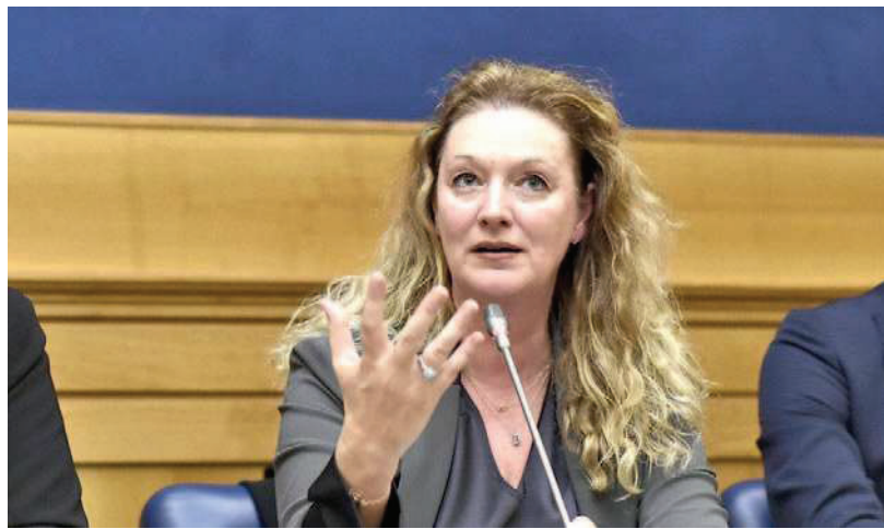
La sindaca di Prato Ilaria Bugetti

La reazione: "Fiducia nei giudici, non mi dimetto"