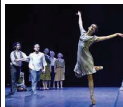
Inaugurazione il 28 giugno