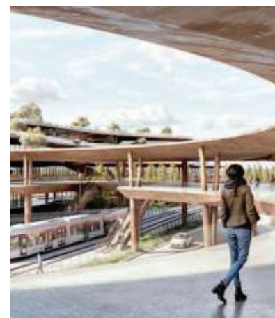
Un rendering del progetto