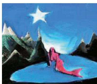
Una sirena di Toccafondo