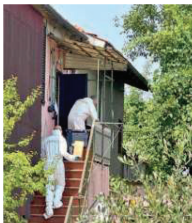
La zona delle ricerche