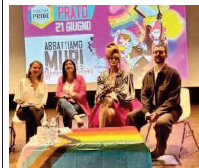
Presentato il Toscana Pride 2025

Una giornata di festa e di rivendicazione dei diritti. È questo il significato del Toscana Pride, in programma a Prato sabato 21 giugno. "Abbattiamo i muri. Tessiamo futuri". È questo lo slogan del manifesto della manifestazione, realizzato dall'illustratrice Agnese Puccinelli.