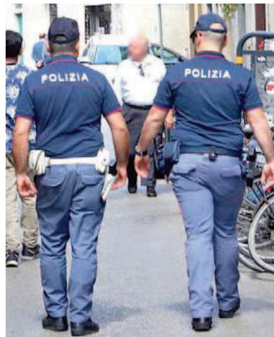
Una pattuglia della polizia

Sarebbe stato un familiare a dare l'allarme ieri mattina e a chiedere l'intervento dei soccorritori che si sono così precipitati alla casa dei due pensionati,