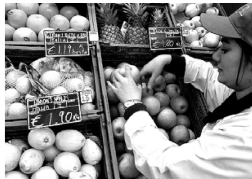
CONTRO IL CAROVITA Pochi anziani stanno approfittando dell'iniziativa del Comune di Giussano

to; dai rivenditori di elettrodomestici al gestore della farmacia comunale. Quella di fornire sconti agli anziani rientrava in un'ottica che aveva un duplice scopo, il rilancio del commercio locale sempre più soffocato dalla grande distribuzione e quella di venire incontro alle esigenze di quei pensionati sia a livello economico sia a livello di qualità del servizio offerto, magari col trasporto della merce a domicilio. Per poter aderire all'iniziativa è necessaria l'iscrizione a uno dei Centri anziani di Giussano e Paina, i quali, rilasceranno anche la tessera dell'Angescio. Attualmente il totale degli iscritti ai centri anziani è di 670 persone, poco più di 200 usufruiscono degli sconti.