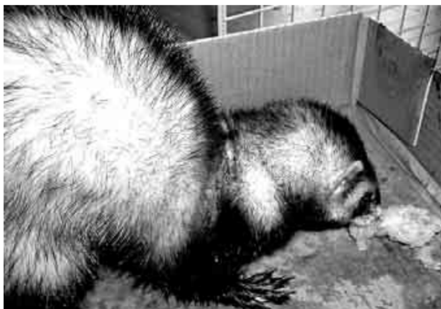
SANO E SALVO Il furetto trovato ieri mattina da una pattuglia della polizia locale in via Donizetti

CARATE (i.b.) Dopo il recupero, nei giorni scorsi, di ben due civette da parte della polizia municipale, ora è toccato a un furetto. Un piccolo mammifero della famiglia dei mustelidi sempre più di moda come animale domestico. Potrebbe essere stato abbandonato da qualcuno che, partito per le vacanze, non si è preoccupato di trovare una sistemazione all'animale lasciandolo in balia del caldo e soprattutto delle macchine. Questa l'ipotesi del comandante della polizia municipale Antonio Frisone: «Siamo stati contattati da un cittadino al quale l'animale è entrato in casa. Il furetto potrebbe essere stato abbandonato da qualcuno che non sapeva come libe-