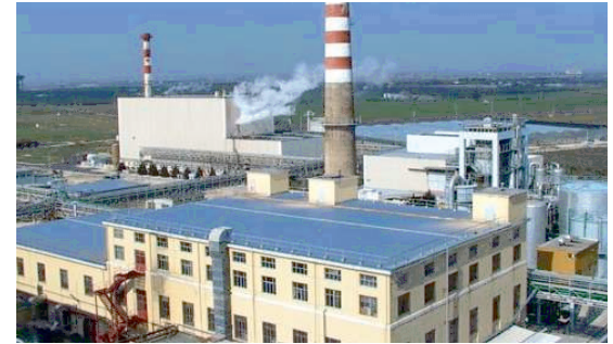
Lo stabilimento produttivo di via del mare