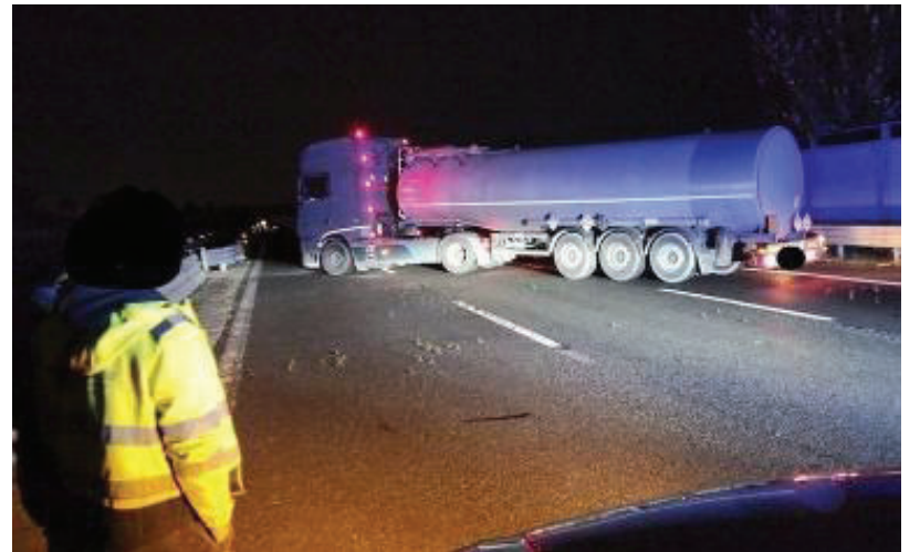
L'autocisterna messa di traverso in A14 per bloccare il passaggio