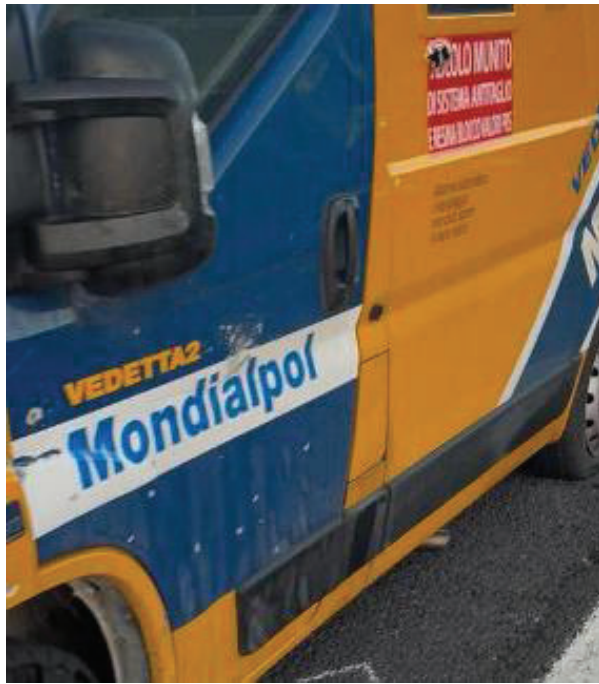
A destra il furgone danneggiato dopo l'esplosione: la cassaforte ha retto. A sinistra la fiancata di uno dei due portavalori crivellata di colpi

«Le nostre guardie erano cinque, tre sul primo mezzo, quello più grande (con il carico, ndr), e due sul secondo, quello di scorta, che viaggiava dietro. All'improvviso un'auto si è attaccata al primo mezzo, affiancandolo; a bordo c'erano i banditi che hanno iniziato a sparare alle ruote e nella zona motore. Il furgone blindato dietro, vedendo la scena, è intervenuto speronando l'auto. Da lì è partito il conflitto a fuoco con i malviventi. Questi ultimi sono scesi e hanno messo la carica di esplosivo sul