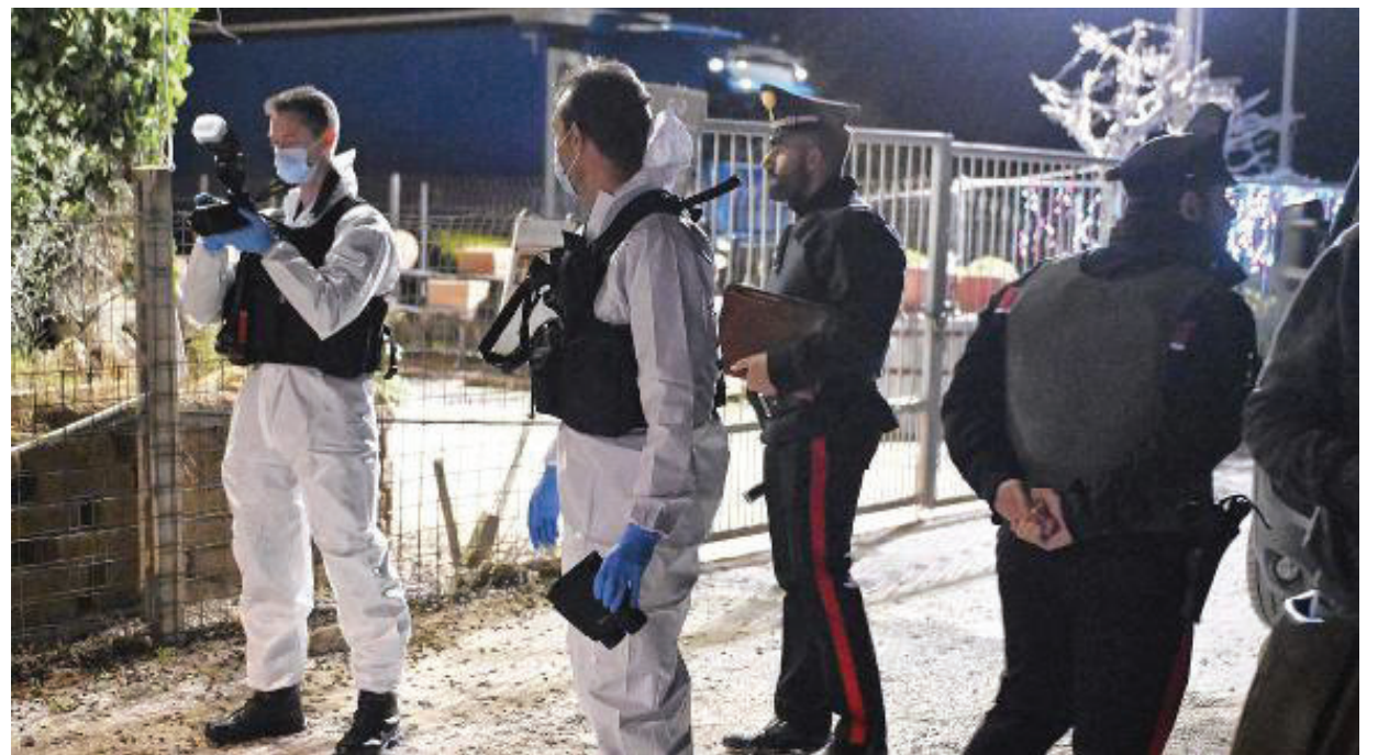
Un momento della conferenza stampa dei carabinieri con il procuratore

Alle 17.45 l'assalto non lontano dal casello di Porto Recanati. «Da quello che sappiamo, e che abbiamo ricostruito anche grazie alla ottima collaborazione con la polizia - ha continuato Chiantese -, almeno cinque persone a bordo di tre veicoli affiancano in corsa i furgoni della Mon-