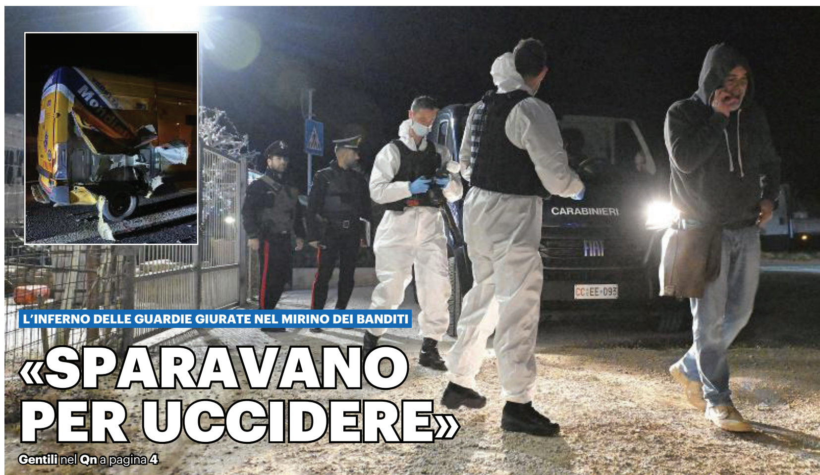
L'INFERNO DELLE GUARDIE GIURATE NEL MIRINO DEI BANDITI

Far west in autostrada: arrestati due basisti e un malvivente ferito. È caccia ad almeno quattro complici Servizi nel Qn e a pagina 3