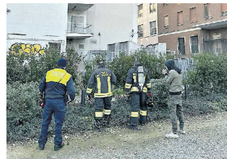
INTERVENTO I Vigili del fuoco e gli agenti della Polizia locale ieri pomeriggio davanti all'ex Telecom di via Carducci