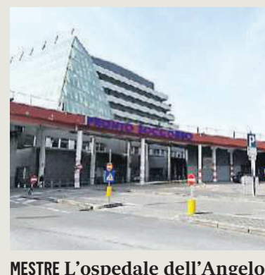
MESTRE L'ospedale dell'Angelo

AMBULATORIO ODONTOIATRICO CONVENZIONATO ASL