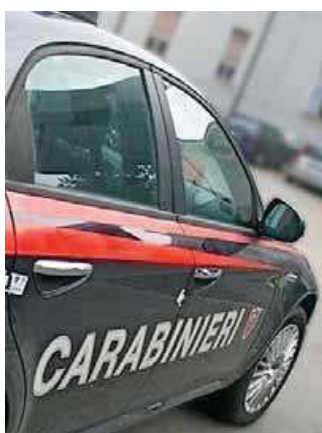
Indagini condotte dai carabinieri

La rete messa in piedi da Delmarco forniva informazioni anche su patrimoni e lavoratori in malattia