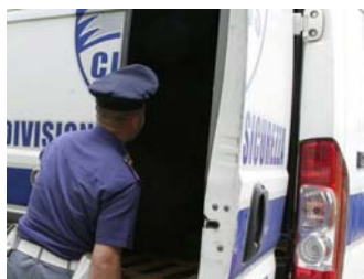
Un agente ispeziona il blindato "alleggerito".