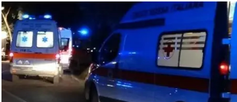
Ambulanze sul posto

Cronaca Incidente a San Giovanni in Persiceto: morto un uomo di 49 anni