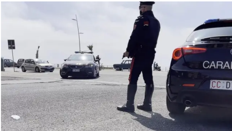
Rapina da film 'crime', l'altra sera, a Castel Maggiore. Sono intervenuti i carabinieri

Tre malviventi con pistole e fucili a pompa hanno bloccato la guardia giurata e sono fuggiti con 60mila euro. Indagano i carabinieri