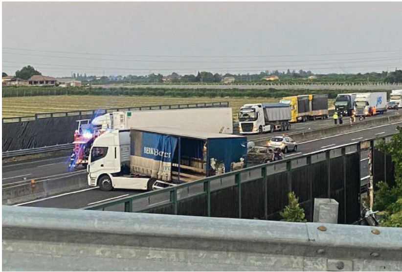
Il caos. Il commando armato ha bloccato l'autostrada A1 per assaltare il furgone blindato della Battistoli con l'esplosivo.

CRIMINALITÀ Auto e tir dati alle fiamme tra i caselli di Valsamoggia e Modena dell'A1