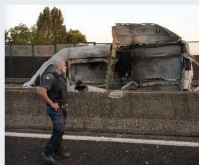
I "protagonisti" Una delle guardie giurate coinvolte