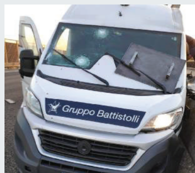
L'assalto I segni rimasti sul parabrezza del mezzo