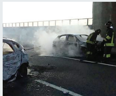
Le fiamme I pompieri al lavoro per spegnere auto e tir