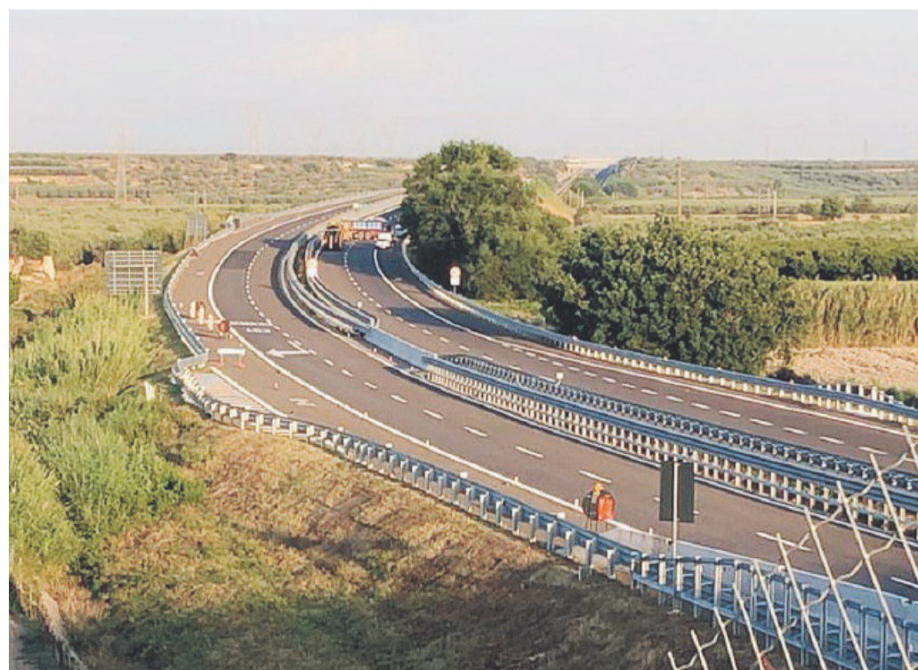
AUTOSTRADA DI FUOCO Un tratto della A14 dove spesso avvengono rapine a Tir o a portavalori