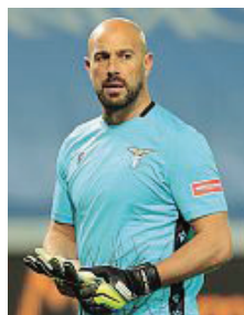
Veterano Il portiere Pepe Reina

I GIALLOROSSI Frattesi, affare da telenovela