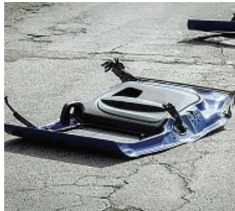
Uno dei portelloni del furgone dei banditi scardinato da loro forse per evitare intralci nell'assalto

È lo scenario da Far West di ieri mattina, poco prima delle 8, fra Tor Vergata, non lontano da università e Policlinico, e Torre Angela. Davanti a un bar affollato di clienti che fanno