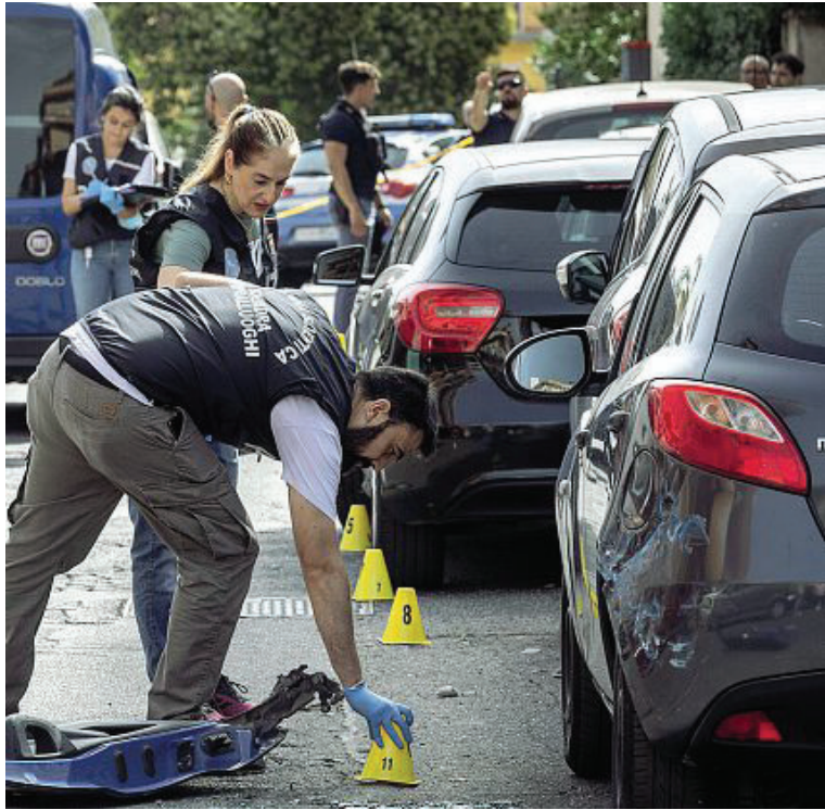
Inferno Tre immagini del clamoroso assalto a un furgone portavalori avvenuto ieri mattina in via Anteo, tra Tor Vergata e Torre Angela, alla periferia est della Capitale. Nella foto grande, i rilievi della Polizia scientifica. A destra il grafico con il luogo dell'agguato