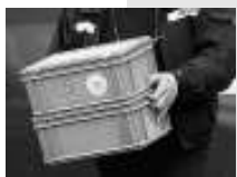
Il denaro era custodito in 4 cassette

TRENTO. Caricare su un furgone cinque milioni di euro non dov'essere facile né veloce. Eppure - secondo le testimonianze - l'assalto dei rapinatori non è durato oltre i cinque minuti. «I malviventi - ha spiegato il titolare della Tfa - hanno portato all'esterno i carrelli nei quali il denaro era raccolto. Parliamo di contenitori un po' più grandi di una cassetta di mele. Secondo i nostri controlli ne dovrebbero mancare tre o quattro». Non dev'essere stato complicato per i rapinatori, quindi, caricare sul furgone rubato i soldi. «Tutto è avvenuto all'esterno del locale - dice Gayer - nel piccolo piazzale. Poi il furgone è ripartito e nessuno ha più sentito nulla». Dalle