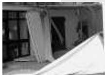
La gabbia del caveau della Tfa

TRENTO. Sono immagini dure che raccontano la paura di un uomo che si è trovato davanti tre banditi armati di kalashnikov. Sono le immagini riprese delle telecamere della Trasporti Fiduciari Atesini. Immagini nitide che raccontano l'assalto armato al caveau e la fuga della guardia verso il piano superiore dove, in una stanza blindata, c'erano le quattro impiegate dell'ufficio contabilità. Si vede l'uomo (ormai prossimo alla pensione dopo 25 anni della vita dedicata al lavoro di guardia giurata) che, rendendosi conto del pericolo reale, corre verso le scale. A pochi passi da c'è uno dei banditi con il kalashnikov spiana-