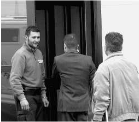
Gli agenti della sezione crimini violenti della questura di Padova: sono a Trento

C'è un altro particolare in questa vicenda. A quanto pare (e a dirlo sarebbero le riprese video) gli uomini del commando indossavano dei