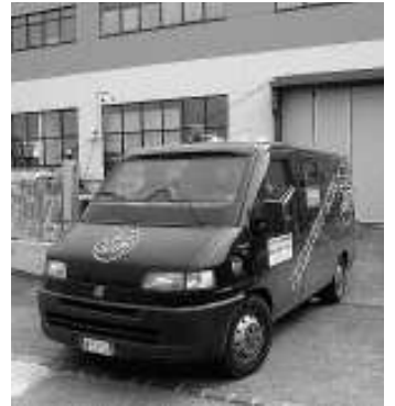
Alla Tfa porta e cancello ricostruiti in tempi record

giornata sono al massimo dieci i minuti in cui il denaro ritirato da banche, supermercati e casse continue, non si trova nel caveau o nella stanza blindata dove avviene la conta. Quando - come lunedì notte - si effettuano le operazioni di scarico i soldi vengono prima contati dagli impiegati dell'ufficio contabilità al piano superiore e quindi trasferiti al piano terra (dove c'è la super cassaforte) attraverso l'ascensore. Qui la guardia giurata prende il contante per portarlo nel caveau. Ed è in questo momento che i soldi sono allo scoperto. Ed è stato proprio in questo preciso momento che i malviventi hanno sfondato con la pala rubata poco prima il cancello e quindi la porta della Tfa.