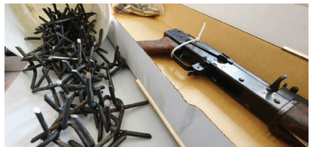
I chiodi che sarebbero stati gettati dai rapinatori per evitare d'essere raggiunti, in caso di fuga dopo il colpo