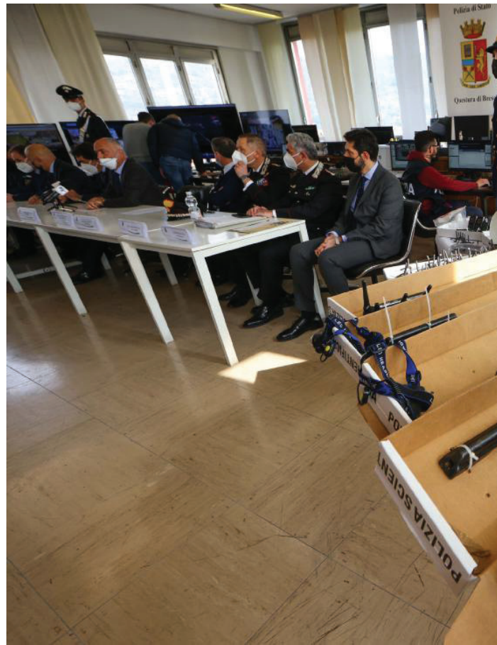
Le armi sequestrate in primo piano, durante l'incontro in cui sono stati riferiti alcuni dettagli dell'operazione

vava da Cerignola, in provincia di Foggia. Ma c'era anche il legame con la 'ndrangheta. E aspetto non trascurabile, se non addirittura fondamentale, tra i 31 finiti nei guai, ci sono anche due dipendenti infedeli dell'istituto di vigilanza destinatario delle attenzioni del maxi commando, istituto appartenente al gruppo Mondialpol e situato a Calcinato. Lì c'era il caveau con gli 80 milioni, di cui, grazie ai basisti, bresciani d'origine calabrese, la banda sapeva tutto. Sapeva e aveva. Sapeva che sarebbe servita una ruspa «con martello» per sfondare i muri, un tir appositamente modificato per trasportare la refurtiva e alcuni dei rapinatori. E, ovviamente, era a conoscenza anche di quanti sarebbero stati a guardia del caveau alle 18.30 di venerdì: cinque, non uno di più. I trenta sarebbero partiti, da Cazzago San Martino, ovviamente, ma anche dalle altre due basi, a Gardone Valrompia e Ospitaletto. Nel capannone di Cazzago erano state portate anche gran parte delle 26 auto rubate e destinate a essere incendiate per garantire la fuga, bloccare gli inseguitori. Pronti anche i chiodi a 4 punte da gettare sull'asfalto e finiti invece in conferenza stampa. Erano al sesto piano della Questura insieme a una parte dell'arsenale sequestrato: in totale, 4 kalashnikov, un fucile a pompa, una mitraglietta, una pistola, munizioni, 21 molotov, e 1 chiodi a 4 punte. La destinazione migliore, non certo nelle intenzioni dei 30 arrestati o fermati.