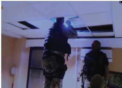
Una fase delle perquisizioni dopo il blitz di venerdì sera

Quello che secondo il prefetto Francesco Messina è stato il «preziosissimo avvio delle indagini» da parte della squadra Mobile di Foggia, da ricondurre alla conoscenza del proprio territorio, ha aggiunto in seguito il vice comandante nazionale del Ros co-