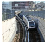
La metro andrà sul Garda?