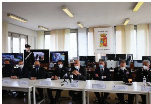
Una fase della conferenza stampa che si è tenuta nella mattinata di ieri in questura a Brescia

lizzato durante l'assalto al caveau. La pianificazione dei rapinatori era stata molto particolareggiata. La professionalità di polizia e carabinieri è stata molto elevata. Si è colto un amalgama nell'intera compagine di polizia giudiziaria che ha portato a una speciale operazione». Il sostituto Paolo Savio, della Direzione distrettuale antimafia di Brescia ha esordito: «Con questa operazione siamo riusciti a dimostrare la "saldatura" tra la criminalità organizzata pugliese e quella calabrese. Per quanto riguarda la Puglia è stata disarticolata quasi completamente una delle strutture cerignolane specializzate in assalti a caveau e blindati. Questi si sono uniti a "ndranghetisti bresciani, poi c'è una zona grigia e quindi i basisti, i fiancheggiatori». Tra le contestazioni di maggior rilevanza, a vario titolo, c'è l'aggravante mafiosa nella duplice articolazione: il metodo mafioso e l'agevolazione delle cosche calabresi e foggiane. Il pm ha anche ricordato che «quella di Ceri-