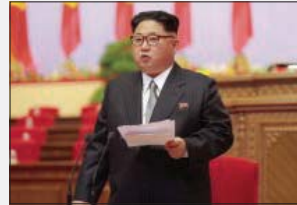
Il dittatore coreano Kim-jong-un

COREA DEL NORD Parole di pace La svolta di Kim il cattivo «Niente più missili e chiusura del nucleare»