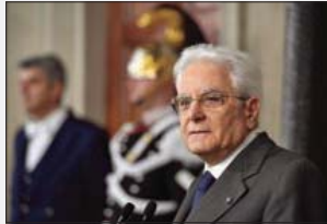
Il presidente Sergio Mattarella

GOVERNO Domenica d'attesa Di Maio elogia Salvini Mattarella pensa a Fico Tutti guardano al Molise