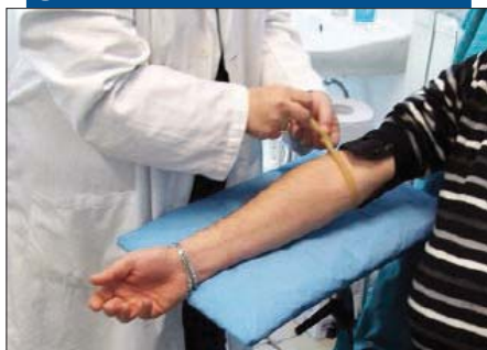
Un laboratorio per le analisi

Tagli e posti a rischio Privati contro Scura