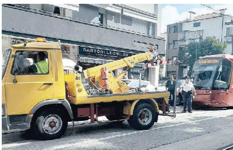
VIALE SAN MARCO L'auto è stata fatta rimuovere dal carroattrezzi

per oltre un'ora (dalle 11.15 alle 12.35) proprio a causa di quell'auto parcheggiata male, tra le proteste e l'ira dei pendolari costretti a scendere dal mezzo di Actv per prendere un autobus per arrivare a destinazione. Già, perché quella svista non ha rallentato il siluro rosso solo per qualche minuto: evidentemente, chi aveva parcheggiato era ben distante dal potersi rendere conto di ciò che stava accadendo. Sul posto sono intervenuti gli agenti della polizia locale e il personale di Avm: è stato chiamato il carroattrezzi che ha rimosso l'auto e liberato il passaggio. Il