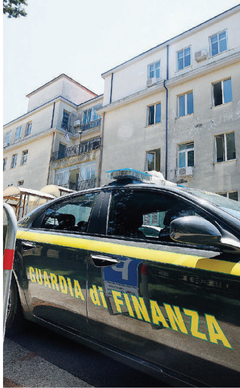
Fiamme gialle Le indagini sono state condotte dalla Guardia di Finanza